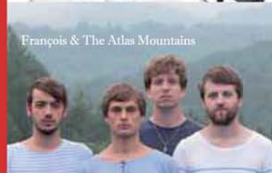
François & The Atlas Mountains

FRANCOIS & THE ATLAS MOUNTAINS MANCEAU / DJ TORDEONDE