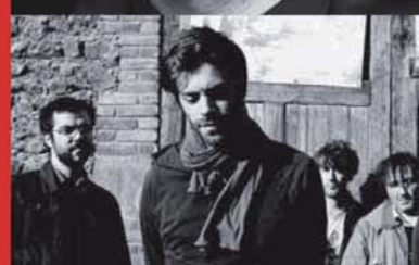
The Delano Orchestra

Association Patchrock CARTE BLANCHE A THE LAST MORNING SOUNDTRACK THE DELANO ORCHESTRA