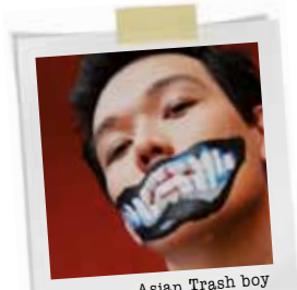
Asian Trash boy