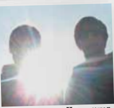
50 Miles From Vancouver

50 MILES FROM VANCOUVER a des idées qui "fuzz", "surf" sur une vague mélodique et bruyante, et donne un coup de fouet au rock garage et à la pop sixties. Le duo est devenu quatuor pour la scène, fin prêt à tailler sa route. Patronyme surréaliste que ce JESUS CHRIST FASHION BARBE . Ces trois messies que personne n'attendait pourraient bien créer la surprise, ils déplaient une pop vive et nerveuse, pas loin du Wedding Present ou de Sebadoh. MEIN SOHN WILLIAM hurle, maltraite sa guitare à grands coups d'archet, triture quelques machines, dédouble sa voix trafiquée, ses rythmes et ses accords dans un tourbillon post-folk et noise acoustique. Trio brestois, IM TAKT dresse un pont prometteur entre l'afropop de Vampire Weekend, le groove de !!!, le math-rock de Foals, le punk funk de LCD Soundsystem et l'electro post-rave de Fuck Buttons.