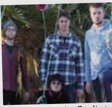
Rhum for Pauline

Dans le plus pur style mod, guitares et amplis vintage, en plein cœur de Rennes, LES SPADASSINS ressuscitent le Swinging London et l'esprit de Carnaby Street, jouant un mélange de rock et soul sixties. Ambiances soul, atmosphères parfois psychédéliques et chœurs mixtes évoquant les plus belles heures de la music, le quatuor nantais RHUM FOR PAULINE affiche son amour pour la musique californienne. MONKEY & BEAR s'abreuve aux mêmes sources néo-psychédéliques que Dan Deacon ou Animal Collective, le quatuor confectionne des chansons colorées et festives. Les trois garçons de DISSONANT NATION n'ont pas froid aux yeux. Quelque part entre The Ramones et The Rapture, le trio assène sans fioritures des chansons élastiques chauffées à blanc.