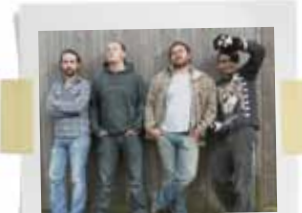
Monkey & Bear